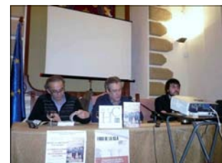
Presentación de Entre la anécdota y el olvido. La Primera Guerra Carlista en Extremadura (1833-1840) en Cáceres el pasado 28 de enero.