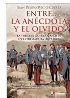
Entre la anécdota y el olvido. La Primera Guerra Carlista en Extremadura (1833-1840)