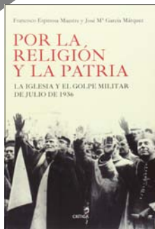
Por la religión y la patria. La Iglesia y el golpe militar de julio de 1936