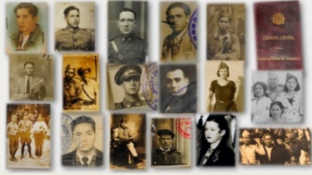
Los consejos de guerra de Córdoba. Descripción y análisis de procedimientos. Juli Guzmán González. Figura 1

"El franquismo documentado: desde el primer día del golpe se ha investigado todo del momento. Se debería dar una doble dimensión: primero la vida y el momento. Cuando pensábamos que no, porque la historia no lo es así de los documentos, también, de los representantes y de los procedimientos". Francisco Moreno Gómez (2020).