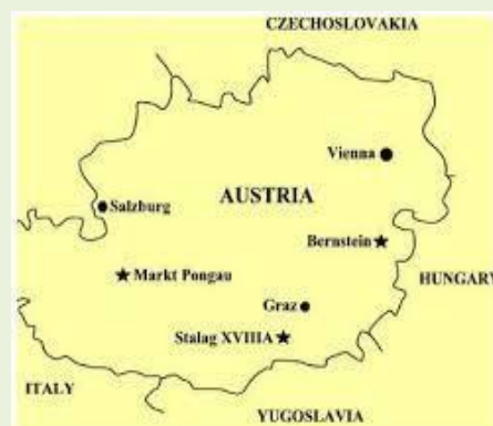
Ubicación del Stalag XVIII-A, entre las ciudades de Graz y Klagenfurt - Wehrkreis XVIII- en Austria.

No se sabe en qué fecha es trasladado al kommando 5 —grupo de trabajo— Ternberg, 6 próximo al kommando Steyr, también dependiente del principal Mauthausen, pero sí, como vemos, cuando muere: 30 de mayo de 1944, un año antes de ser liberado, tanto Mauthausen como todos sus kommandos (habían llegado al campo principal cerca de 10.000 españoles y regresaron solo, aproximadamente, cerca de 4.000), en Ternberg.