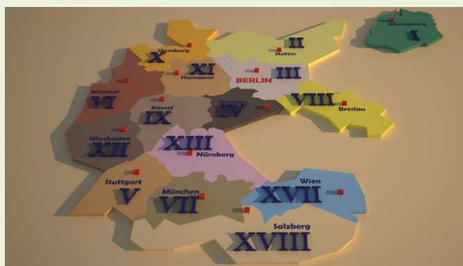
Distribución de los wehrkreis (distritos militares) en territorio alemán, y otros ocupados.