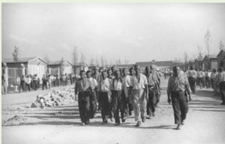
Grupo de trabajadores, posiblemente españoles en Mauthausen, dirigiéndose a trabajar. Pudieran ser, por qué no pensarlo, los españoles del Kommando César.