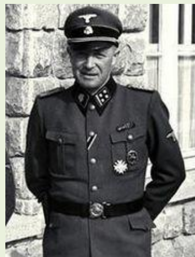
Franz Zierys, Standartenführer (coronel SS lagerkommandant (jefe supremo del campo) de Mauthausen