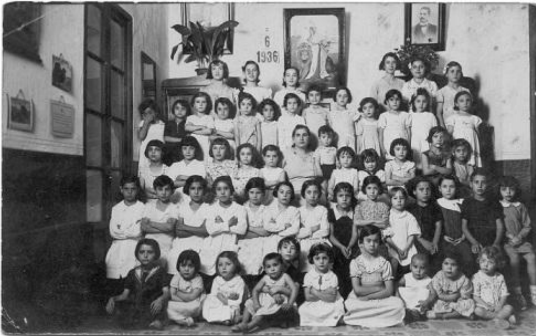
Escuela de la calle Enladrillada. Junio de 1936