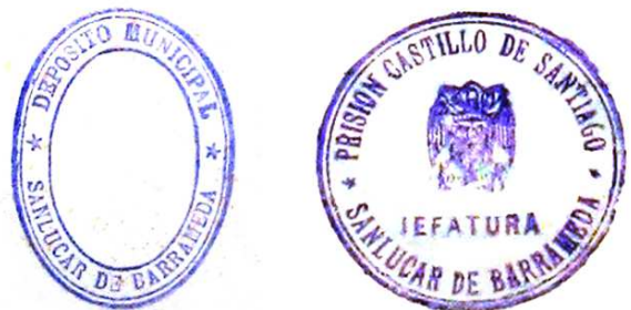
Sellos del depósito municipal (izquierda) y de la prisión del castillo de Santiago (derecha) utilizados en 1939.

El ingreso de estos presos no ha quedado reflejado en el registro de entradas y salidas de