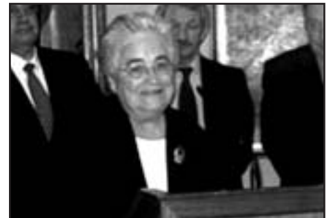
Pren possessió de la Presidència del Consell Escolar del Estado, 2004

ción y Vicepresidenta. De 1993 a 1996 es senadora electa por Barcelona. De 1982 a 2002 es miembro del Consejo Escolar del Estado.