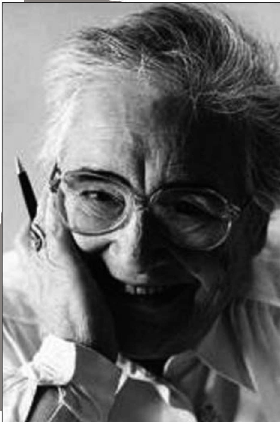
Marta Mata i Garriga (1926-2006). Licenciada en pedagogia y creadora de las escuelas "Rosa Sensat".

Portaveu de l'Associació per a la Memòria Històrica i Democràtica del Baix Llobregat