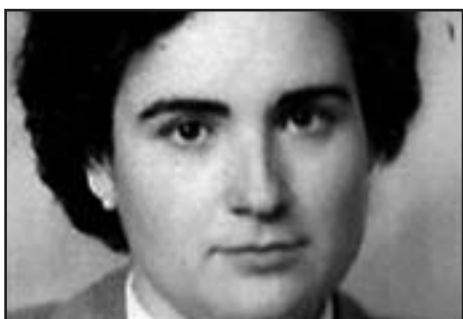
Estudiante de Pedagogía a la UB, 1955

Desde 1945 a 1965, y por razones de salud, reside en Saïfores, pequeño pueblo del Penedés donde empieza a dedicarse a la educación del tiempo libre de sus niños. Desde allí también, estudia, libre, Filosofía y Letras, y se licencia en Pedagogía en 1957. En los últimos años cincuenta y los primeros sesenta orienta la creación de varias escuelas nuevas, que intentan recuperar y poner al día el movimiento de renovación pedagógica que culminó en la II República.