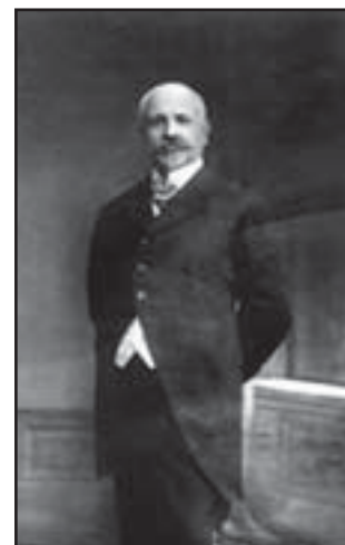
Francesc Ferrer i Guàrdia (1859-1909). Fusilado en Montjuic el 13 de octubre 1909

Conocí directamente a Marta Mata durante una Escola d'Estiu celebrada en Bellaterra (Barcelona). Era poco después de morir Franco y los partidos políticos de la izquierda y el catalanismo se esforzaban en elaborar discursos y propuestas prospectivas. La política lingüística y la escolar eran dos de los centros de renovado interés público. Recuerdo un encendido debate durante el cual algunos representantes del nacionalismo de derechas propugnaban la instauración de una doble red escolar según la lengua de la enseñanza escogida por los padres y alumnos. Marta Mata se revolvía en su silla y se