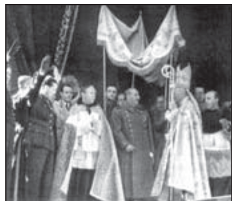
Franco bajo palio. El servilismo de la iglesia a Franco.

Me pusiste el listón tan alto que tratar de seguirte ha sido imposible para mí. Tu recuerdo y tus consejos los he tenido siempre presentes, pero aunque no guardo rencor no he podido perdonar y tampoco he llegado a olvidar. A pesar de la templanza de tu compañía y de vuestro celo para que no me afectara el entorno en que vivíamos, mi infancia fue muy dura. Aún recuerdo a aquellas gentes hambrientas, tosiedo por la tuberculosis, que buscaban en ti el remedio de sus males, cuando ya