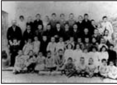
1910. Escola pública de Vilaur (Girona)

talana s'introduirà a l'escola. De ser perseguida per Primo de Rivera ara serà reconeguda. A finals del mes d'abril de 1931, el mateix mes que s'havia proclamat la República, el Decret sobre la llengua establirà que És un principi universal de Pedagogia que l'ensenyament primari, per tal que sigui eficaç, s'ha de produir en la llengua materna. (...) Respectar la llengua materna, sigui quina sigui, és respectar l'ànima de l'alumne i afavorir l'acció del mestre permetent que s'acompleixi amb tota plenitud. D'aquesta manera a les escoles de casa nostra alguns dies la classe es farà en català i d'altres en castellà o els matins en català i les tardes en castellà o viceversa. El fet important és que la llengua que parlaven els infants a casa i al carrer també entrarà a l'escola. Els llibres escolars i de lectura infantils ja feia temps que es podien trobar en català.