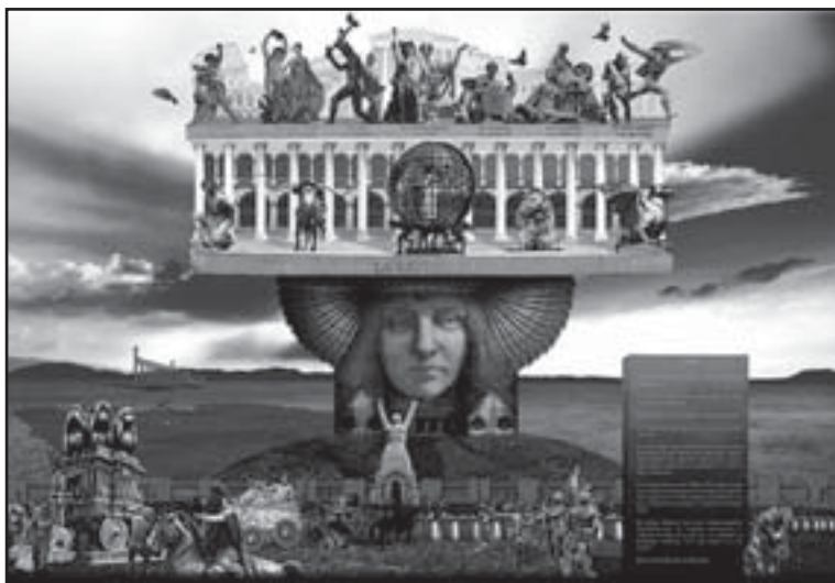
La República de las ideas

Ahora, tras muchas décadas, no hay responsables, sólo es historia, pero sí ha llegado a la gente la información de lo que acontecía en aquella época en Rute. La clase política y otra mucha gente buena están sacando a la luz las injusticias y la barbarie de aquellos años. Os están haciendo muchos homenajes a todos los desaparecidos y perseguidos. También ha sido escrito un libro por un historiador con mucho prestigio que ha colocado a cada persona en su sitio. Recientemente, en vuestra memoria ha sido inaugurado un monumento muy emotivo que ha sido donado por un escultor importante, y en las escuelas nuevas, de tan mal recuerdo, se ha construido un Centro Cultural al que el alcalde ha prometido ponerle tu nombre.