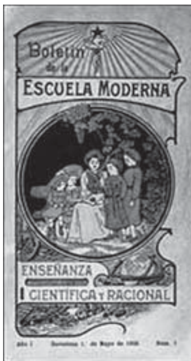
Portada del boletín de la Escuela Moderna.

El éxito de sus razonamientos y de sus propuestas ha sido total, absoluto en su concreción. Los dos gobiernos de la Generalitat de Catalunya, el de Jordi Pujol y el de Pasqual Maragall, han asumido como "política de estado" la necesidad de una red única, flexible y atenta a los cambios sociales, pero con el catalán como instrumento de integración y de promoción social, como lengua instrumental de la enseñanza y como lengua simbólica del país. Los valencianos, desgraciadamente, y contra toda norma de prudencia social, hemos desarrollado el modelo opuesto, su negativo. Los diferentes gobiernos socialistas y también populares han mantenido el castellano como lengua de la enseñanza y el catalán, el valenciano, como opción voluntaria a partir de la libre elección de profesores, alumnos y padres de alumnos. El resultado es, lógicamente, el contrario que el conseguido en Cataluña, con independen-