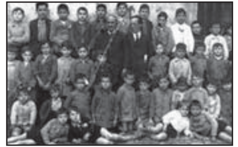
La escuela fusilada. Maestros de la República con sus alumnos

o más que los cuantitativos. No hay que olvidar que la purga expulsó de la enseñanza al sector del Magisterio más comprometido con las reformas políticas y sociales de la República, que era en buena medida el más comprometido también con la renovación pedagógica que, durante las décadas anteriores, se había impulsado en diversos lugares de España, y que había tenido un especial relieve en Cataluña, por lo que los efectos que la depuración tuvo sobre la calidad del sistema educativo público fueron terribles. En Cataluña, a esas