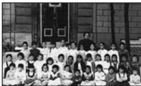
1957. Escola Milá i Fontanals (Barcelona)

El buit deixat pels mestres exiliats, expulsats, morts, etc. s'omplirà amb altres persones escollides amb criteris molt més polítics que no pas pedagògics. La convocatòria per a la provisió de places del 25 de març del 1939 deixarà ben clar quins seran els motius preferents per a l'adjudicació de places: 1. Ser mutilado como consecuencia de la actual guerra, siempre que la mutilación no imposibilite el ejercicio de la Enseñanza. 2. Ser herido en la actual campaña, siendo preferido, dentro de este orden, el que mayor número de heridas demuestre haber sufrido. 3. Haber prestado servicios militares, como combatiente, en la actual guerra. 4.