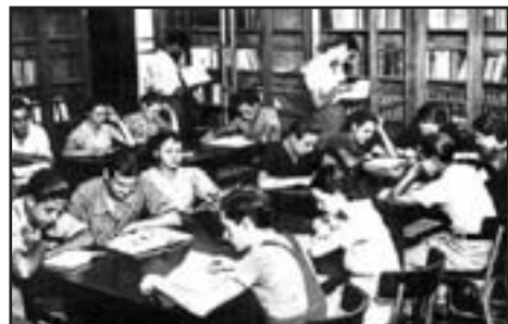
Educar en la guerra. Els obrers que somniaven en estudiar.

i aquest introduí canvis significatius respecte de les competències de la Generalitat. Entre els canvis introduïts, que retallaven les atribucions de la Generalitat, s'assenyala que el nou redactat de l'Estatut reconeixia el dret de la Generalitat a establir nous Centres educatius propis, però, al mateix temps, l'Estat continuava tenint totes les seves atribucions en matèria educativa. A més, els traspassos de competències s'eternitzaven, la qual cosa convertia en paper mullat els drets de la Generalitat, per manca de recursos econòmics.