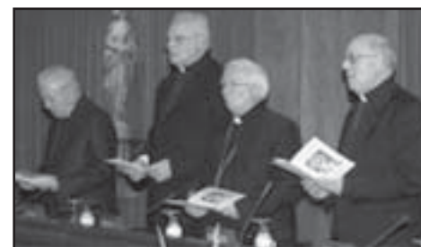
Conferencia Episcopal. De der. a izq. El Obispo Blázquez y los Cardenales Cañizares y Amigó

R. El tratamiento de la diversidad y también la educación infantil. En la actualidad tanto los niños como los padres están desasistidos en este aspecto, y debe potenciarse el carácter educativo de este ciclo. Por otra parte, creo que las leyes educativas deberían ser de base, y dar mayor libertad al profesorado para desarrollar su creatividad en diferentes aspectos, como es el tratamiento de la inmigración.