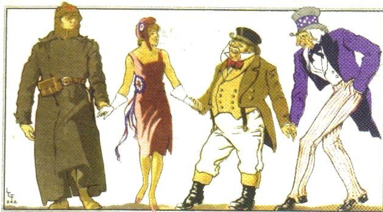
La unión de las fuerzas democráticas acabará por siempre con la guerra. Cataluña seguirá luchando el máximo espacio para que el año 1938 sea, para España, posterior de la Paz y la Victoria.

Todos los Nombres ha nacido como un proyecto de ámbito andaluz: andaluces represaliados dentro y fuera de Andalucía y represaliados en territorio andaluz cualquiera que sea su naturaleza y residencia —como es el caso de gallegos presos en centros penitenciarios andaluces que actualmente están en la base de datos—. Pero en noviembre de 2006 se ha roto la frontera andaluza al incorporar información sobre más de 7.500 fusilados en la provincia de Badajoz. Actualmente la base de datos sobrepasa los 22.000 registros y se espera alcanzar en breve la cifra de 30.000. El surgimiento de iniciativas similares en otras comunidades autónomas plantea la necesidad y el reto de crear una base de datos de ámbito estatal o, cuanto menos, establecer una coordinación y protocolos de trabajo comunes.