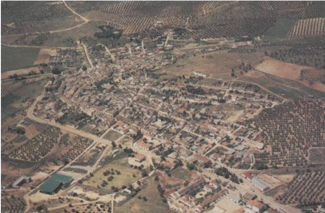
Paronámica de Sorihuela del Guadalimar