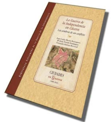
La Guerra de la Independencia en Cáceres. Las sombras de un conflicto , II Premio de Investigación Histórica José María Calatrava de Caja Extremadura.

- El jueves 15 de enero , en la Biblioteca Pública de Cáceres y a las 20.00 horas , se proyectará el nuevo documental de Producciones MORRIMER , Los refugiados de Barrancos . Organiza el GEHCEx.