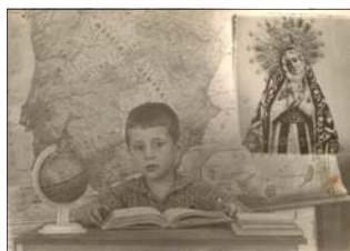
Fotografía característica de la escuela extremeña de los años 60.

Nuestra web ya ha alcanzado las 25.000 visitas.