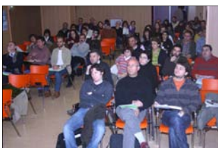
Otro instante del IV Encuentro Historiográfico del GEHCEx. En la fotografía, detalle del salón de actos de la Biblioteca Pública de Cáceres, adonde los asistentes debieron dirigirse por motivos de aforo.

La historia es la política pasada, y la política es la historia presente.