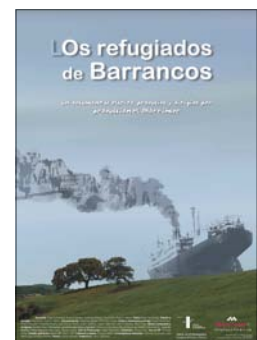
El nuevo documental de Producciones Morrimer Los refugiados de Barrancos podrá verse el 15 de enero en la Biblioteca Pública de Cáceres.