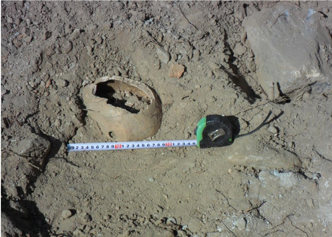
Fig. 14. Detalle de cráneo con impacto de bala. Se observa salida por la zona occipital del mismo.