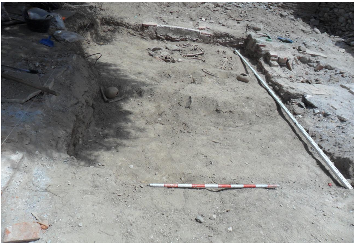
Fig. 31. Vista panorámica de la zona B donde han aparecido los restos al terminar los trabajos el día 1 de julio de 2013.

En espera de que se tomen las decisiones pertinentes por parte de la Junta de Andalucía, la excavación queda postergada.