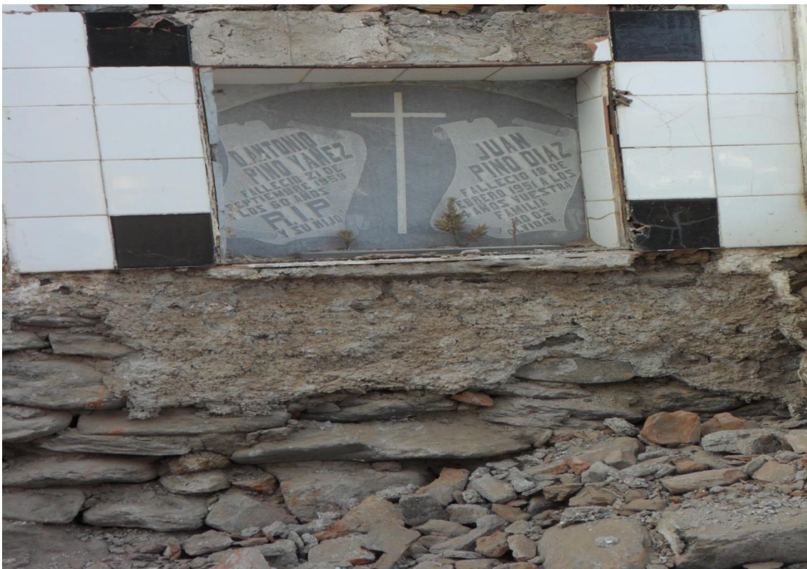
Fig. 25. Lápida de alguna de las tumbas de la década de los 50 que posiblemente afectaron a la fosa republicana.