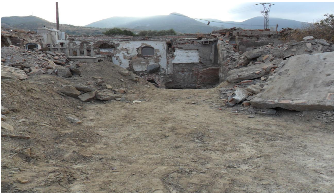
Fig. 4. Vista general del antiguo cementerio donde se observan los primeros trabajos de desescombros en la Zona A.