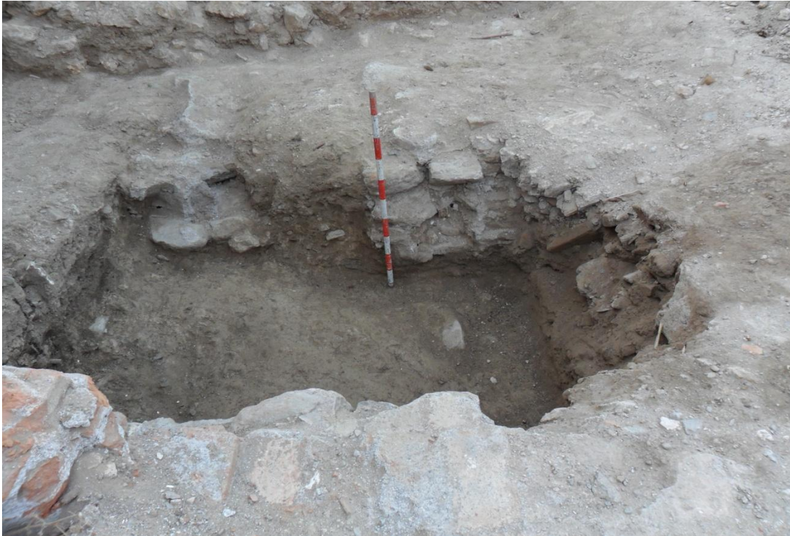
Fig. 23. Perfil sur del sondeo. Se observan distintas tumbas con ataúd seccionadas en el perfil.