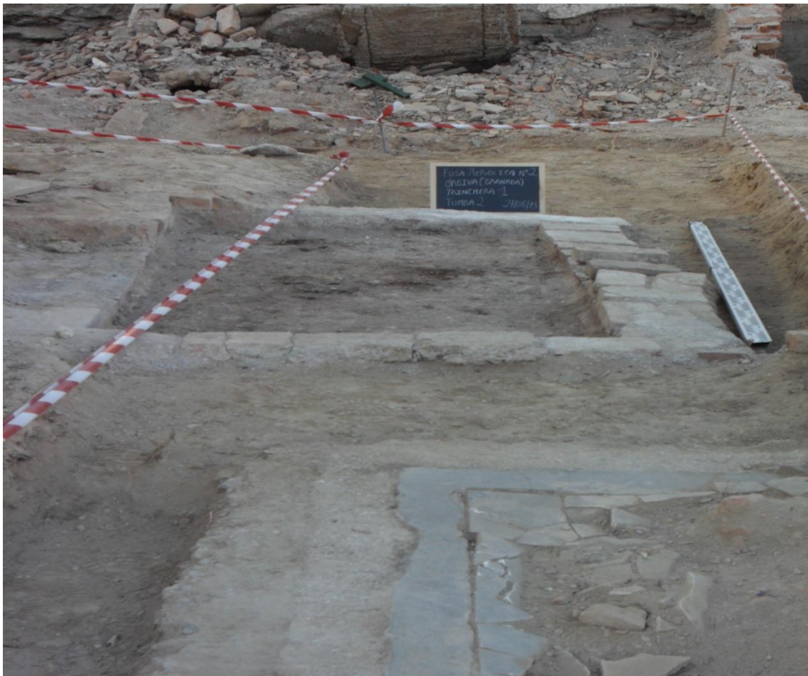
Fig. 13. Vista general de la Tumba nº 2 de la Zona B.

Concluimos que la tumba nº 2, es una tumba contemporánea que ha sido reutilizada, colocando una serie de restos envueltos en tela seguramente producto de la limpieza de otro nicho de un familiar.