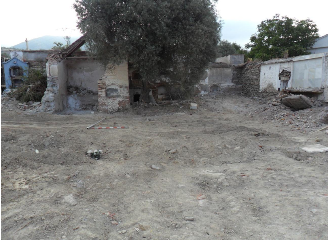
Fig. 7. Zona B antes de la intervención arqueológica