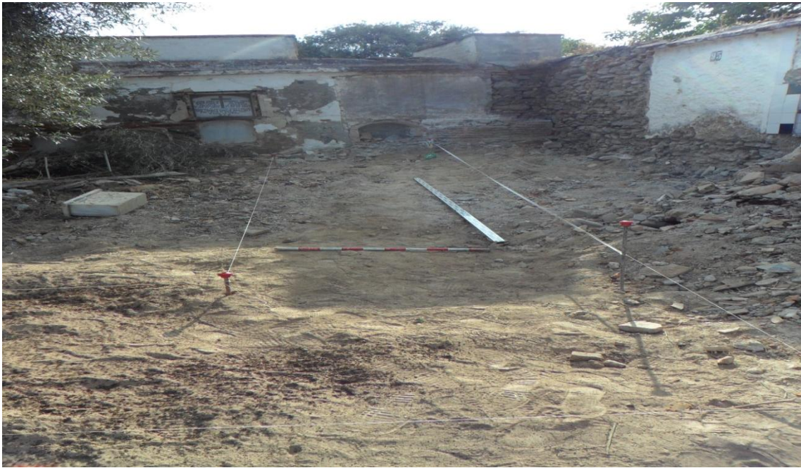
Fig. 10. Vista general de la Trinchera n° 2 antes de comenzar la intervención.

Trinchera 2(espacio lateral): 5'5 x 1'5 m