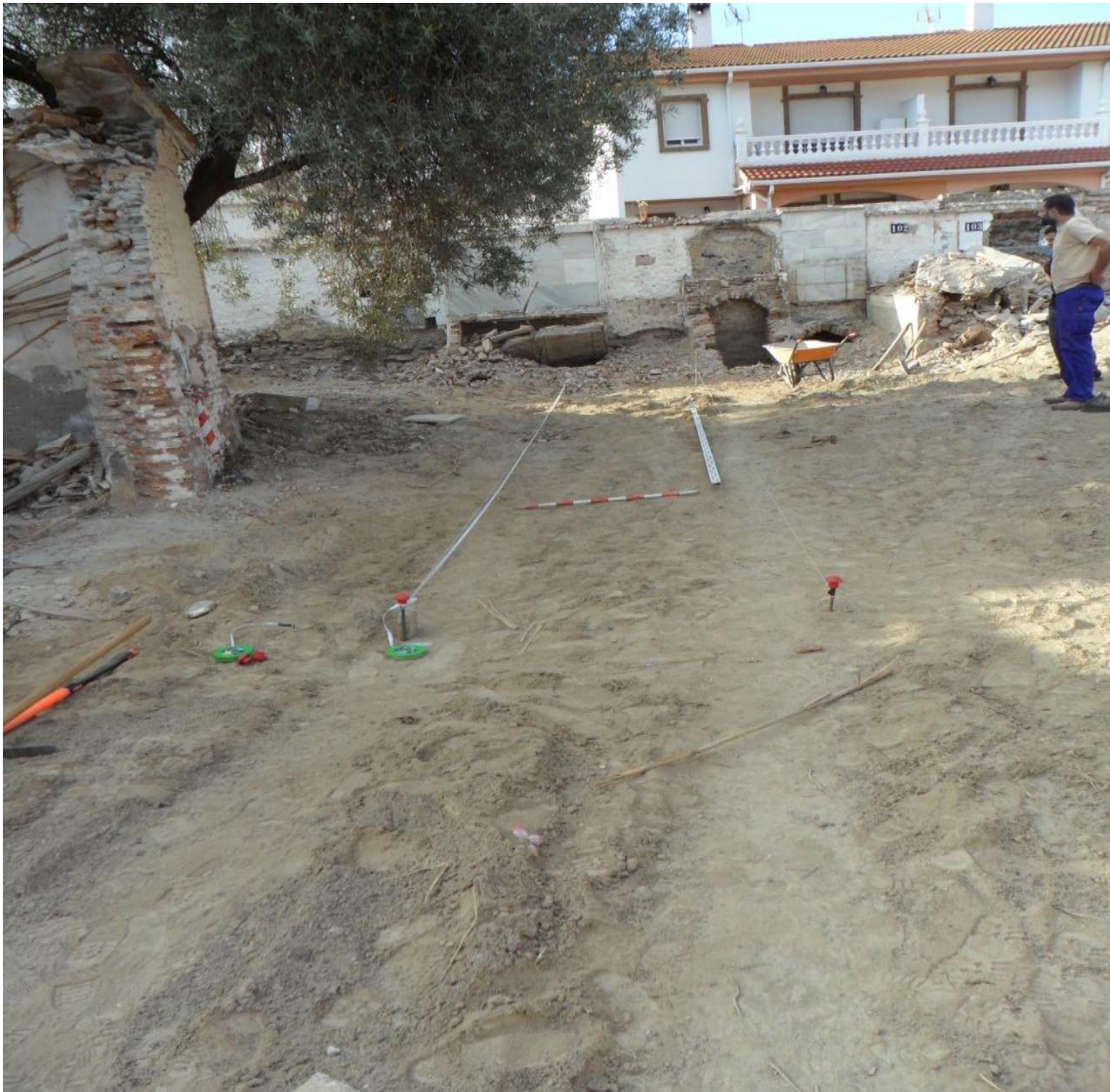
Fig. 9. Vista general de la Trinchera nº 1 antes de comenzar la intervención.

Trinchera 1( espacio delantero): 10 x 1'5 m