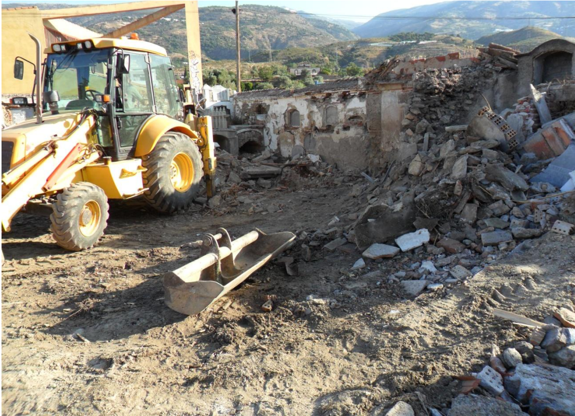
Fig. 17. Vista panorámica de la zona A antes del desescombro.