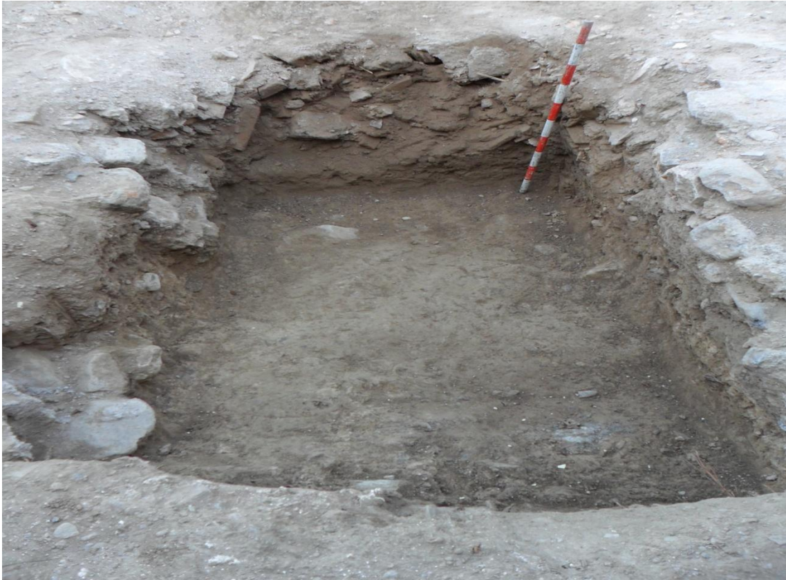
Fig. 21. Perfil oeste del sondeo. Se observa de forma clara como los escombros ocupan todo el perfil hasta el sustrato geológico.