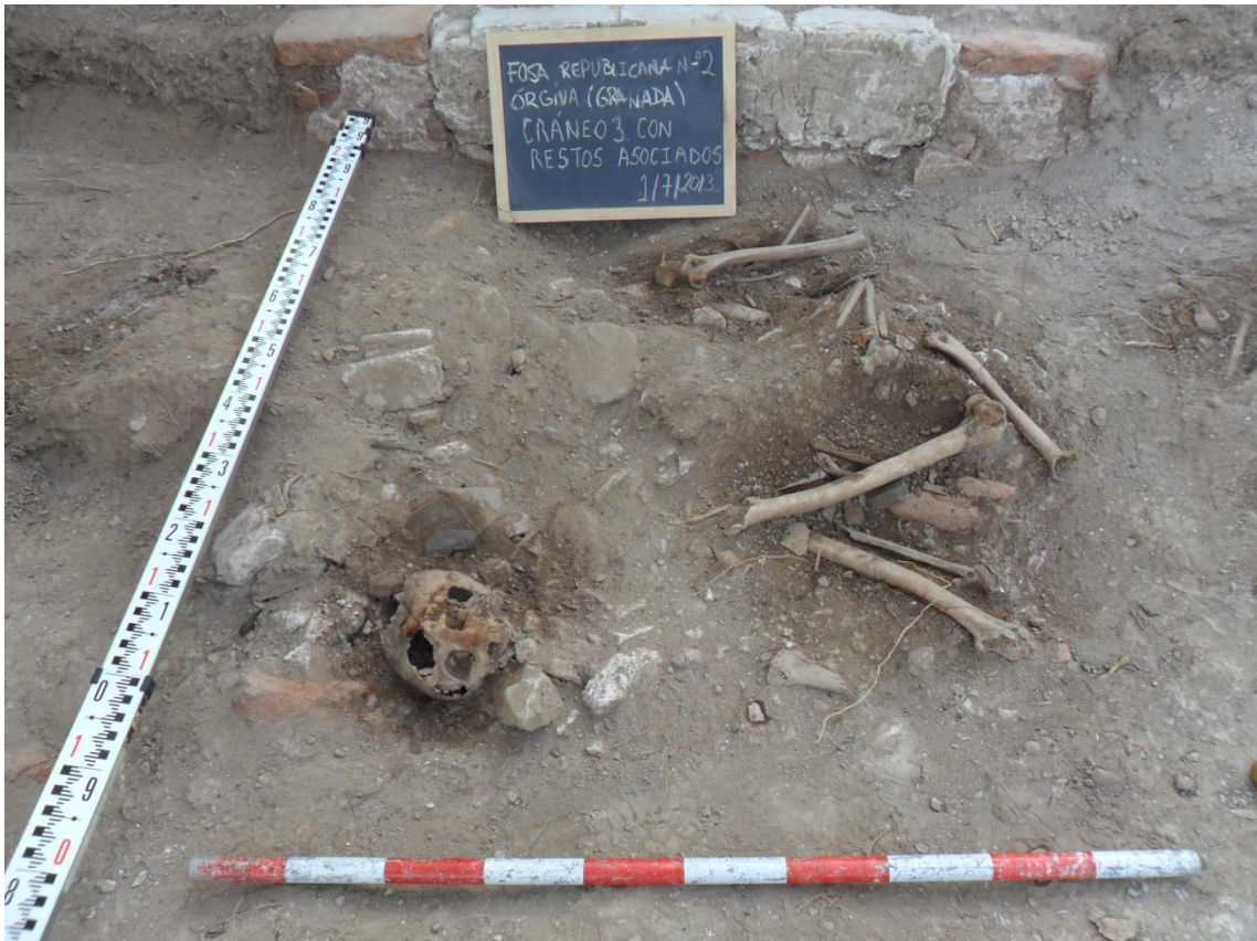
Fig. 29. Detalle del cráneo nº3 con restos posiblemente asociados a este.