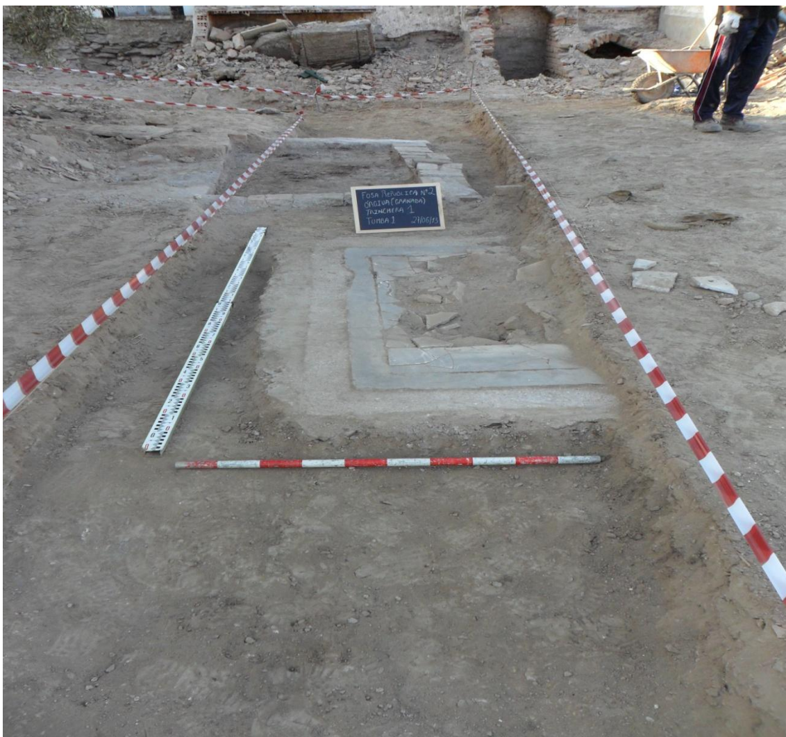
Fig. 12. Vista general de la Tumba nº 1 de la Zona B.

Descripción: Tumba de adulto con lápida de mármol de color blanco fuertemente fragmentada probablemente por la presión durante los trabajos de desmantelamiento del cementerio.