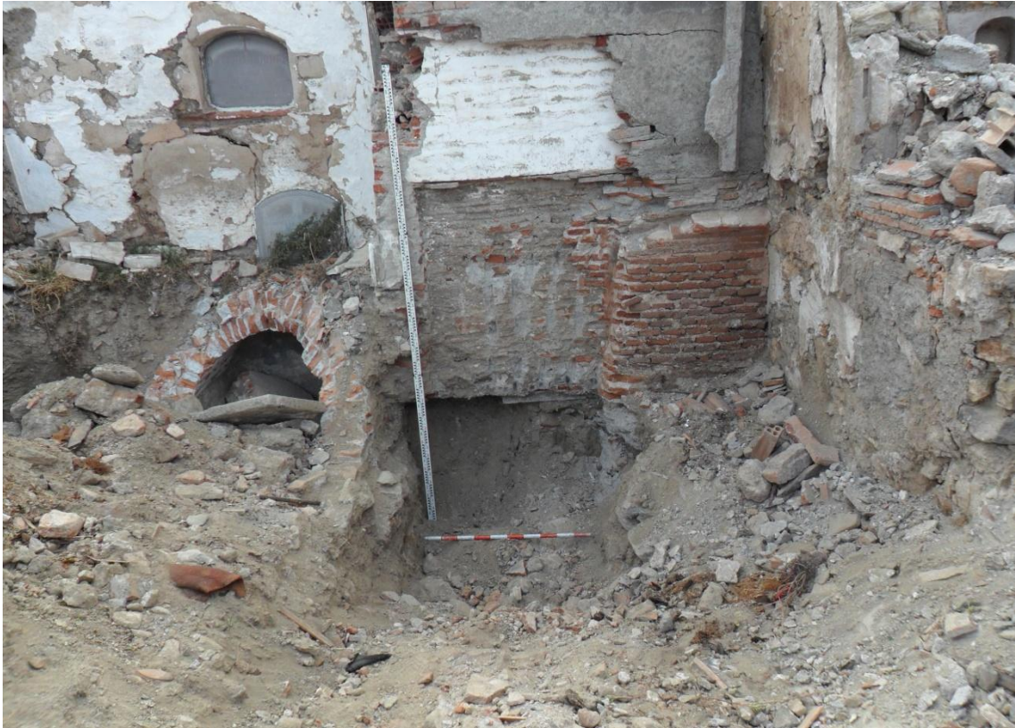
Fig. 5. Vista general del antiguo cementerio donde se observan los primeros la Zona A antes de la intervención arqueológica.