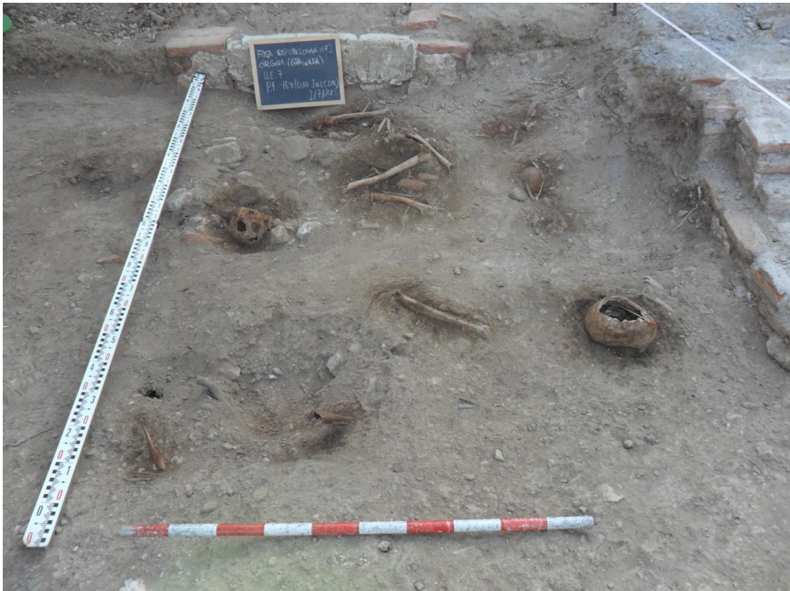
Fig. 27. Sector sureste de la cuadrícula donde se observa la mayor concentración de restos óseos. En la parte derecha de la foto se observa cráneo con impacto de bala con entrada por el frontal y salida por el occipital izquierdo.