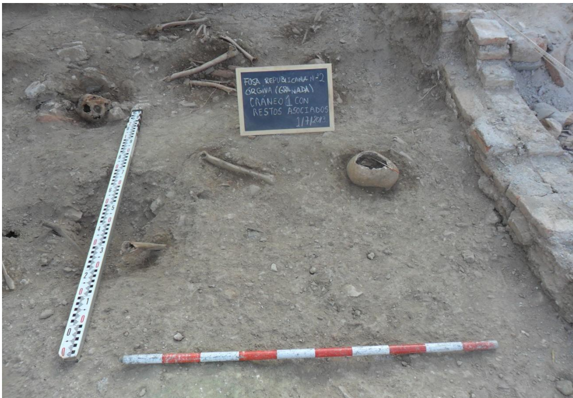
Fig. 28. Detalle donde se observa el cráneo n°1 con impacto de bala y distintos huesos largos que podrían estar asociados con él.