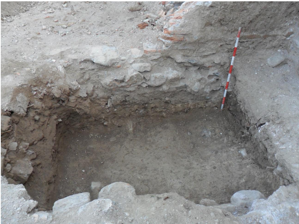
Fig. 20. Perfil norte del sondeo. Se observan distintos niveles de relleno y cimentación de nichos contemporáneos.