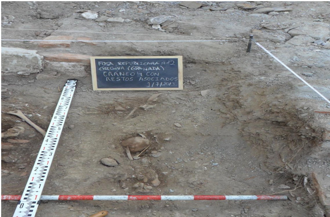
Fig. 31. Cráneo nº 4 con restos asociados.