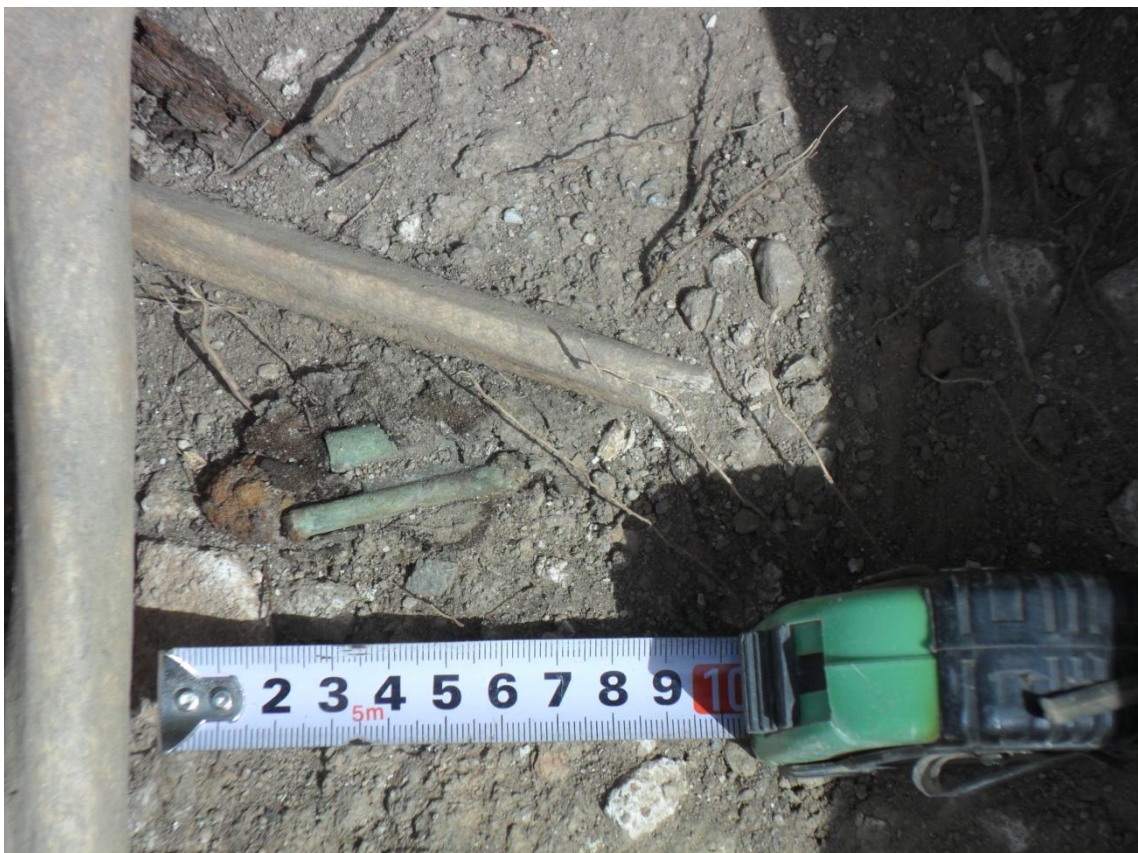
Fig. 30. Detalle donde se observa un mechero de yesca junto a dos huesos largos (fémur y tibia) asociados a cráneo nº 3. Nuestra experiencia nos indica que este tipo de evidencia, con una muy alta probabilidad, pertenece a la fosa republicana que buscamos.