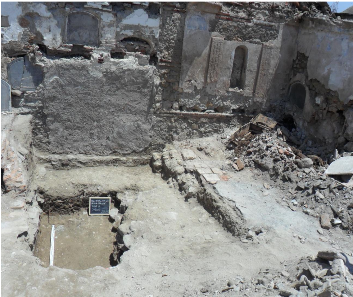
Fig. 18. Vista panorámica de la zona A una vez desescombrada.