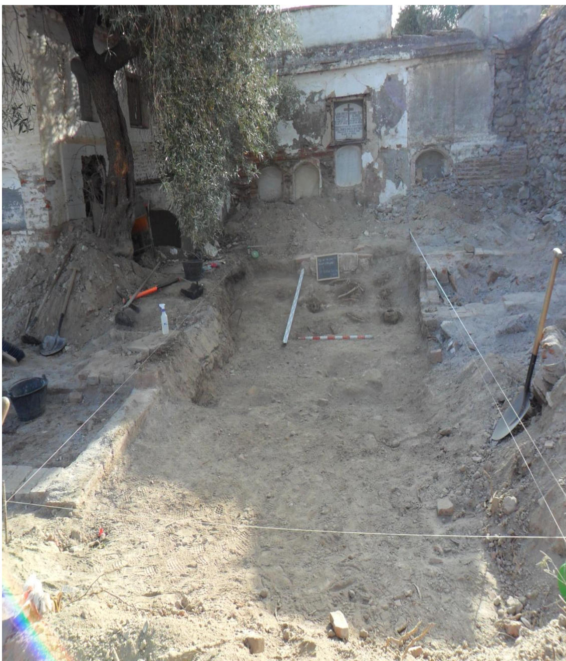
Fig.26. Vista panorámica de la zona donde se han localizado los posibles restos de la fosa republicana.

Se continúan los trabajos de excavación, observándose cada vez más restos óseos. Finalmente se pueden ver de forma clara cuatro cráneos (uno de ellos con impacto de bala), varios fémures, tibias, perones, así como multitud de restos óseos de pequeñas dimensiones ( falanges, vértebras, costillas...). Se decide parar hasta que se tomen las decisiones pertinentes por parte de la Junta de Andalucía en relación con la posible denuncia de los hechos.