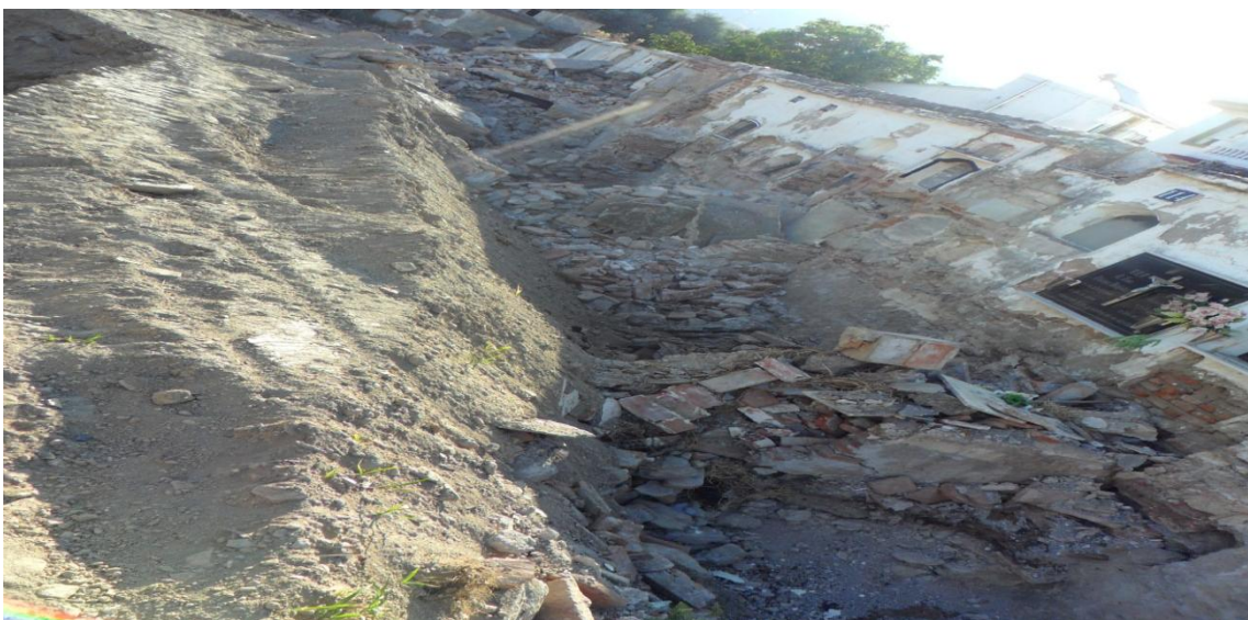
Fig. 2. Vista general del antiguo cementerio donde se observa como el trabajo de desalojo de nichos y columbarios se simultanea con el vaciado del solar.