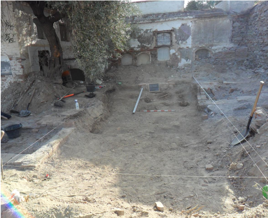
Vista panorámica de la zona donde potencialmente han sido arrojados los restos de la fosa republicana.