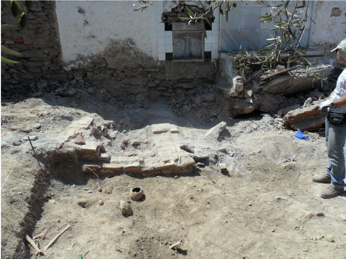
Fig. 24. Panorámica donde se observan las distintas tumbas contemporáneas que posiblemente afectaron a la fosa en la década de los años 50.