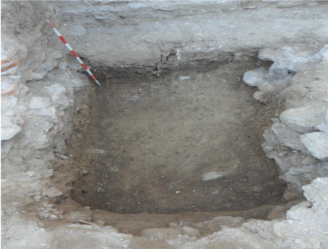
Fig. 19. Vista general del sondeo abierto en la zona A por la retroexcavadora, una vez que se procedió a su limpieza.