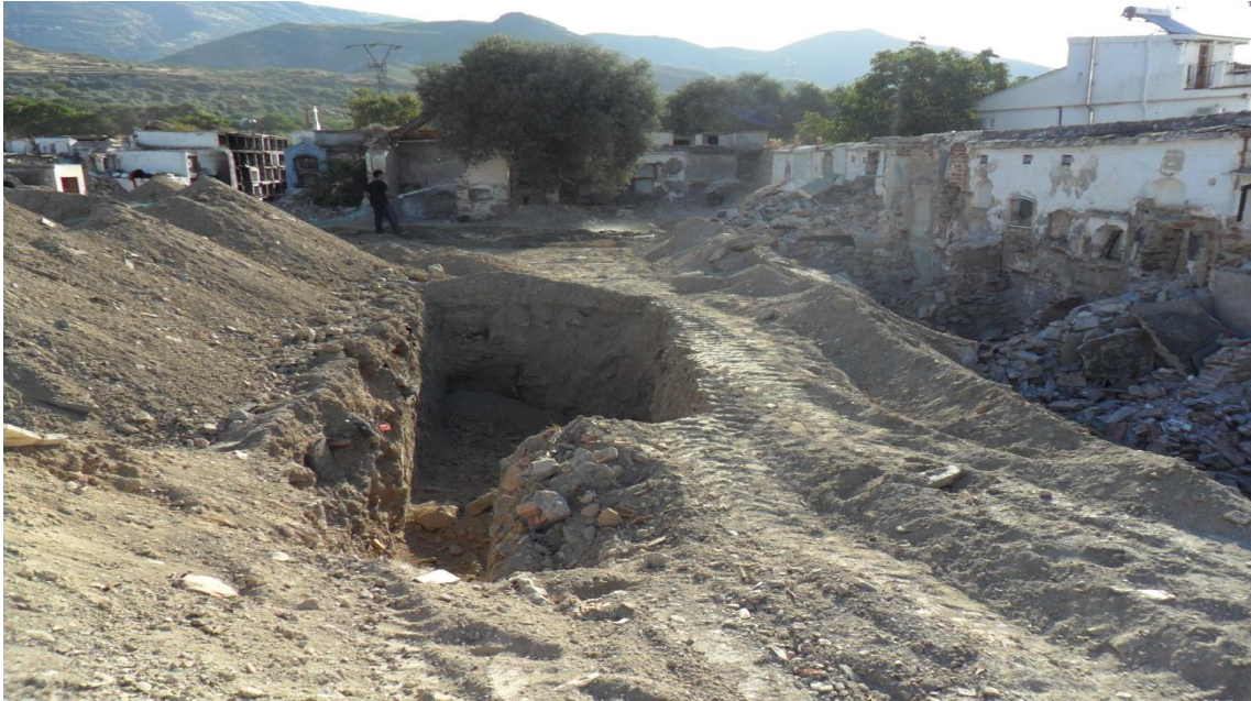
Fig. 3. Vista general del antiguo cementerio donde se observa como el trabajo de desalojo de nichos y columbarios se simultanea con el vaciado del solar.