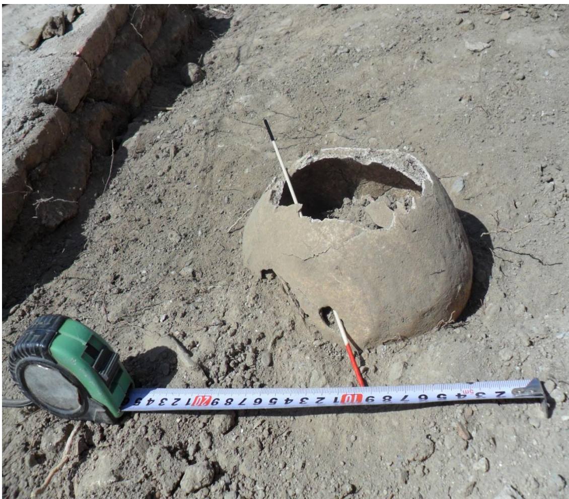
Fig. 16. Detalle del cráneo donde observa la entrada y salida del proyectil.

La trinchera 2 se amplia para transformarse en una cuadrícula de 5,5 x 3m, que ocupa prácticamente todo el espacio libre entre la antigua ermita y las tumbas próximas que se sitúan en los muros este y sur.