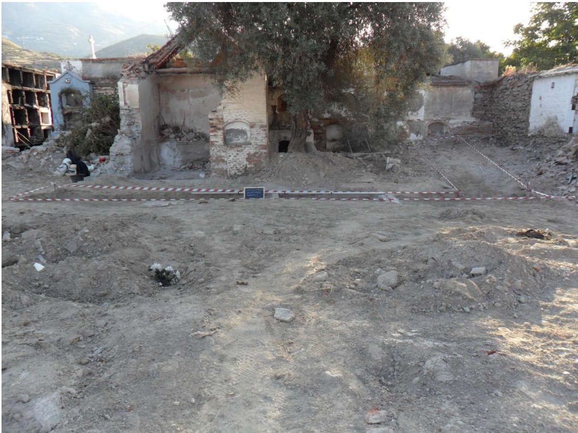
Fig. 11. Vista general de la Zona B donde se observan las dos trinchera proyectadas.

El punto 0 se toma en el muro perimetral del cementerio, concretamente, en el muro lateral a la ermita a una altura de -1'44 m. Las cotas iniciales de la trinchera 1 al norte es de -1'54 m y al sur -1'68 m y en la trinchera 2 es de -1'20 m.