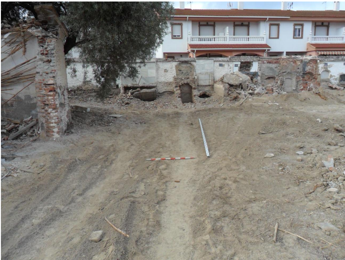
Fig. 6. Zona B antes de la intervención arqueológica