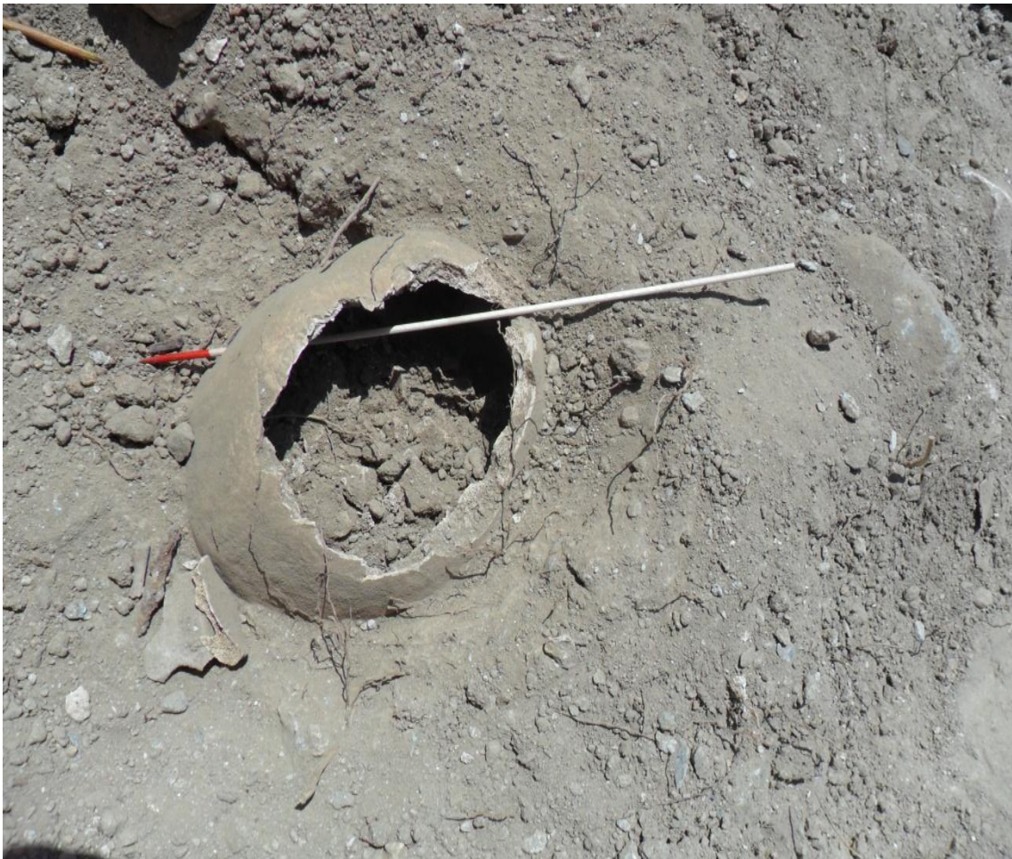
Fig. 15. Detalle de cráneo con impacto de bala donde se observa la entrada y salida del proyectil.