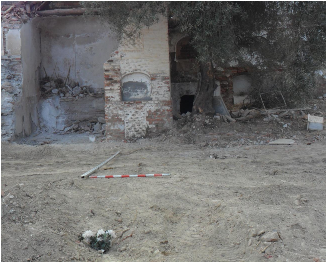
Fig. 8. Zona B antes de la intervención arqueológica.