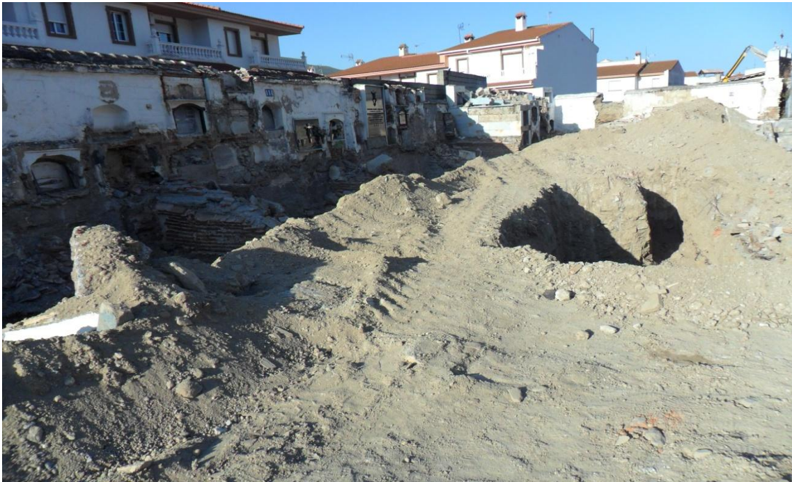
Fig. 1. Vista general del antiguo cementerio en pleno desmantelamiento y antes de la intervención arqueológica.

Después de la primera visita realizada el jueves 20 de junio de 2013 por parte de la D.G.M.D., el Excmo. Ayuntamiento de Órgiva, familiares de víctimas y arqueólogos, se evidenció, tras una primera visual del cementerio, que el trabajo de desmantelamiento del mismo se encontraba en pleno proceso. Tras proceder el desalojo de los columbarios y sin haber derribado estos se han iniciado las tareas de vaciado del solar, aumentando de forma clara las dificultades en cualquiera de los trabajos arqueológicos que vamos a iniciar.