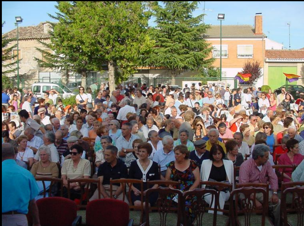
HOMENAJE EN VILLAVIUDAS (PALENCIA) Agosto de 2004 En Agosto de 2003 se exhumaron en Olmedillo de Roa (Burgos), los restos de ocho personas de Villaviudas. Un año después el Ayuntamiento hace entrega de los restos a las familias que los inhumarán juntos en un panteón del cementerio.