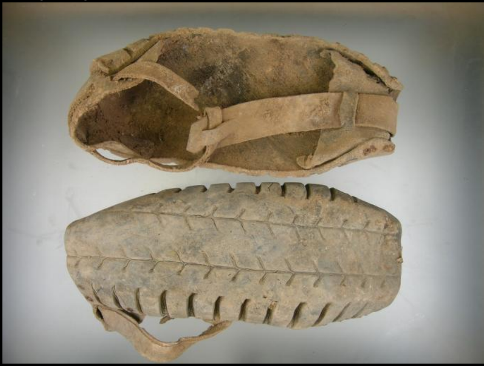
Las abarcas con suela de neumático era calzado típico campesino. Estas se encontraron en la fosa de Arándiga, Zaragoza.