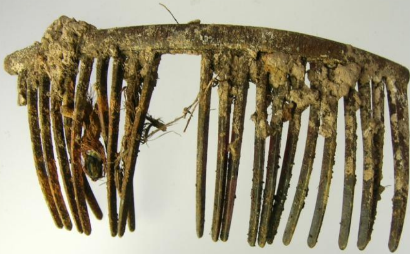
Peineta encontrada en la fosa del cementerio de Illueca, Zaragoza, exhumada en Noviembre de 2007. De los dieciocho individuos exhumados, dos eran mujeres.