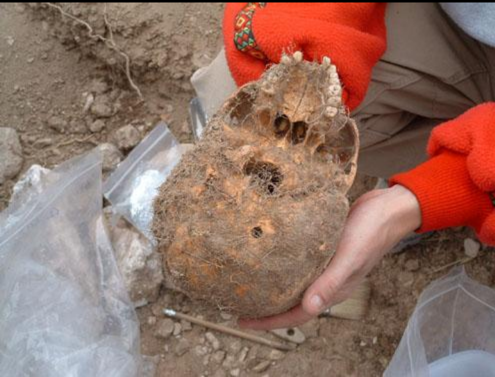
EXHUMACION EN FUSTIÑANA (Navarra) Octubre de 2005

En la fosa de Fustiñana se encontraron los esqueletos de siete personas de Murchante asesinadas en Noviembre de 1936. Todos ellos tenían herida por paso de proyectil en el cráneo.