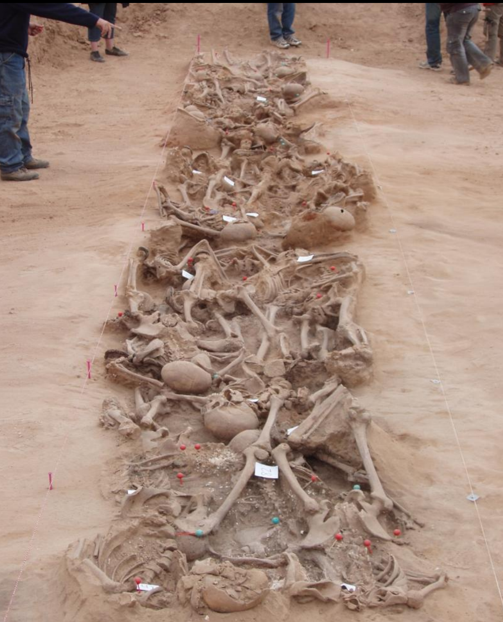
Exposición de los restos