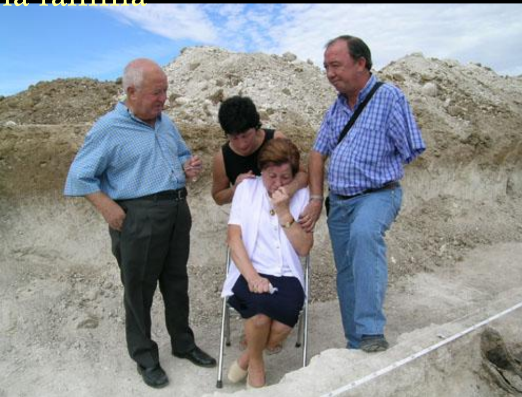
EXHUMACION EN CANILLAS DE ESGUEVA (BURGOS)