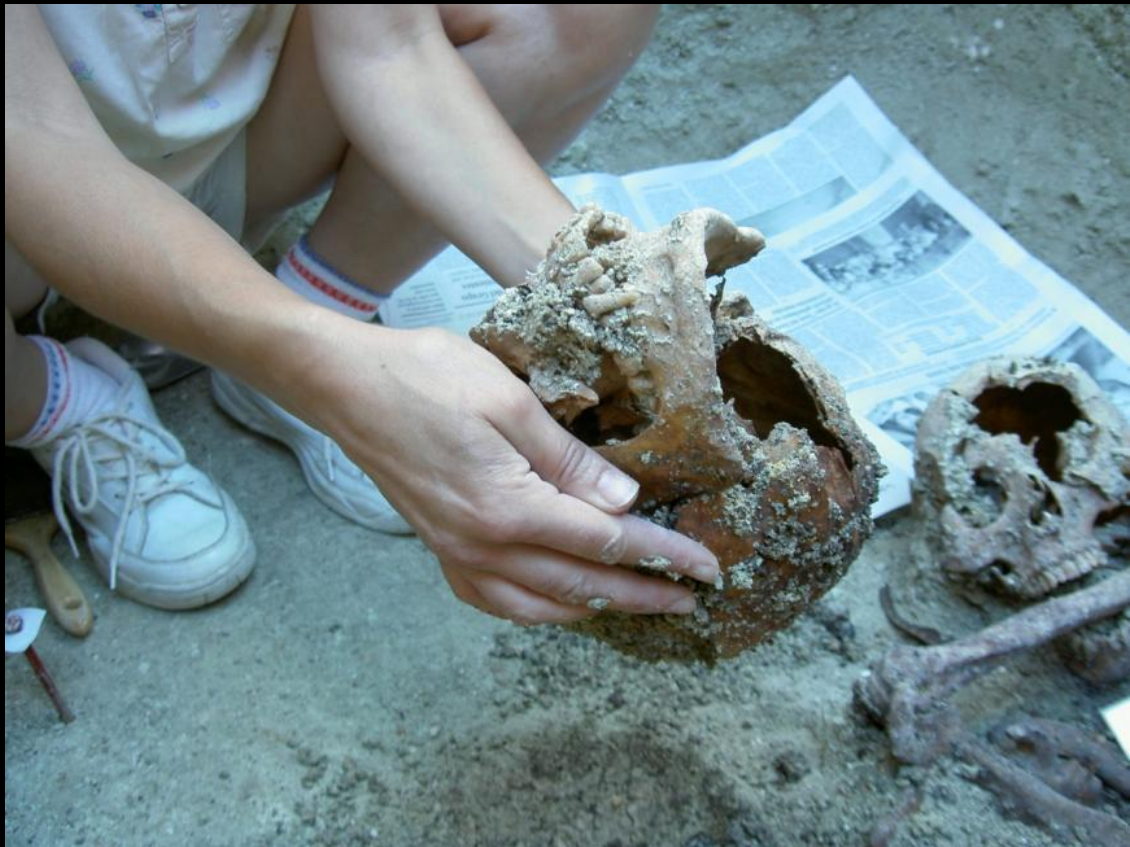
EXHUMACION EN EL CEMENTERIO DE BENEGILES (ZAMORA) Julio de 2004

La extracción del cráneo, normalmente fracturado, es uno de los trabajos más delicados.