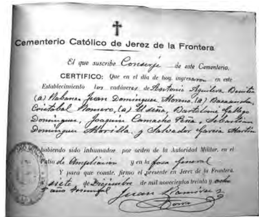
Certificado de enterramiento en la fosa común del cementerio de Jerez de los siete vecinos de Setenil condenados a muerte en la causa 168-37.