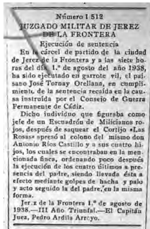
Jerez-5: La ejecución con garrote de José Tornay Orellana, de Alcalá del Valle, publicada en el Boletín Oficial de la Provincia de Cádiz.