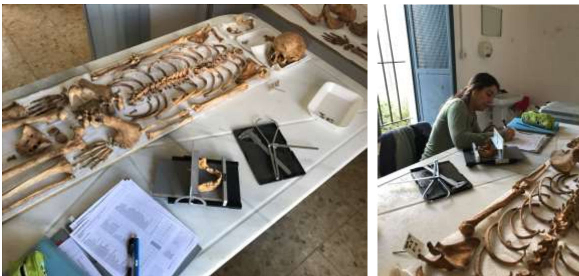
Documentación en laboratorio de los restos humanos hallados en la Fosa I.

Los cuerpos hallados fueron documentados y exhumados, siendo trasladados al laboratorio habilitado en la Sala de Autopsias del Cementerio Municipal, donde se procedió al estudio antropológico y a la limpieza, fotografía e inventario de las pertenencias personales.