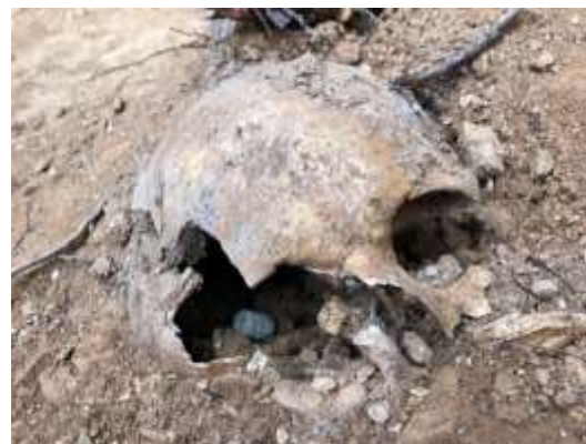
Hallazgo de restos humanos con signos de muerte violenta en la Fosa I.