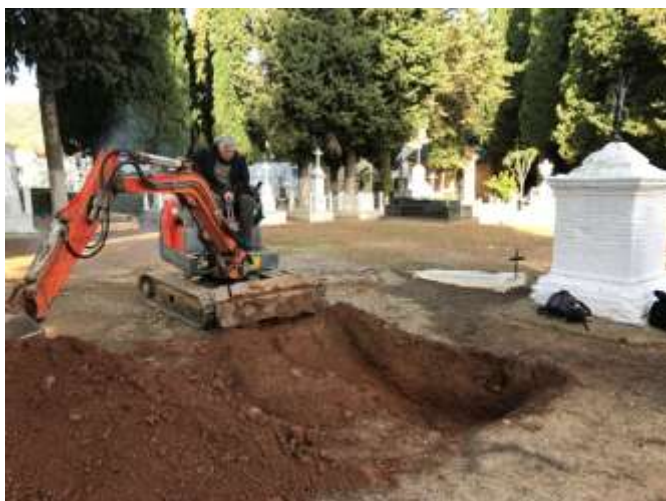
Trabajos con medios mecánicos llevados a cabo en distintos sectores del cementerio municipal.