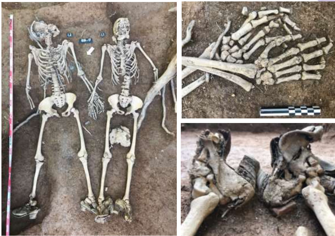
Documentación en campo de los restos humanos hallados.

Trabajos de laboratorio: Limpieza, estudio y depósito.