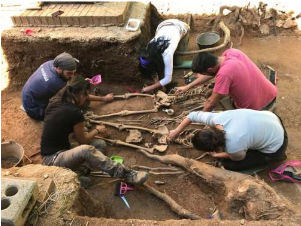
Proceso de limpieza de los restos humanos con signos de violencia hallados en la Fosa I.