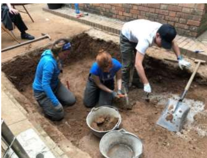
Proceso de limpieza del área para abordar la exhumación de los restos humanos hallados. A la derecha, recuperación del estado del sitio tal y como lo dejamos en Diciembre de 2016, para abordar la fase de exhumación