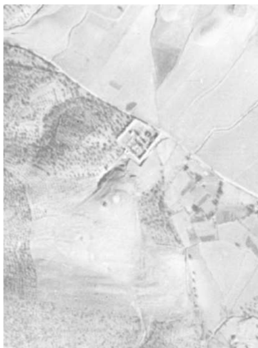
Imagen del Cementerio de San Francisco del IRYDA de 1972.

El siguiente dato nos lo proporciona el Vuelo del IRYDA de 1972, que nos ofrece una imagen del sector en un momento inmediatamente anterior a la edificación del Panteón de las Hermanas Rojo Yanes.