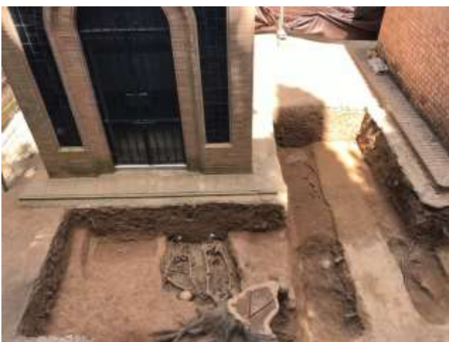
Excavación parcial de la Fosa II.