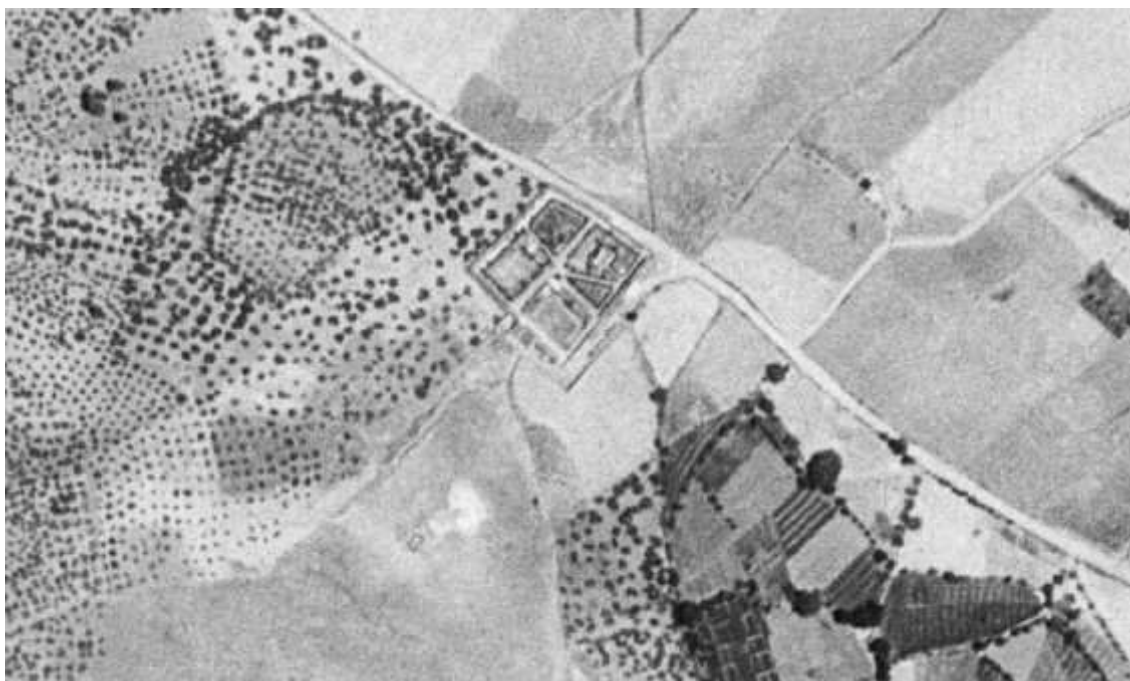
Imagen del Cementerio de San Francisco en el Vuelo Americano de 1956.