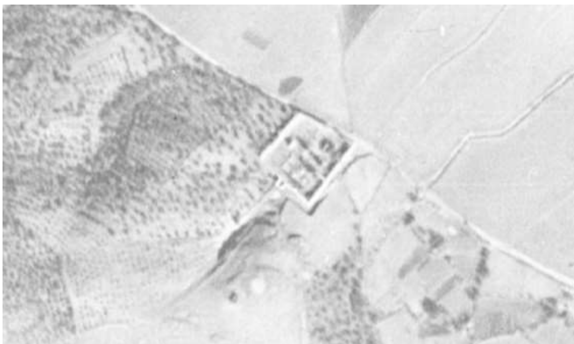
Imagen del Cementerio de San Francisco en el Vuelo Americano de 1945.

tal y como podemos apreciar en la cartografía histórica correspondiente a las series del Vuelo Americano de 1945 y 1956.