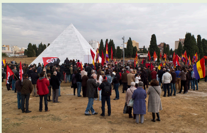
Inauguración del monumento en el cementerio de San Rafael de Málaga (10-1-2014)

Hay que señalar que, aunque el contador no se vea moverse demasiado, el número de nuevas incorporaciones es importante. Pero aún más lo es el número de modificaciones