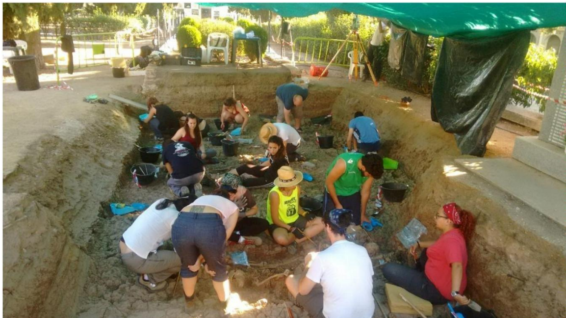
Búsqueda de personas fusiladas en julio 2016 por la ARMHEX en la “fosa común”, al lado de donde se erigió el memorial dedicado a las víctimas de la dictadura franquista