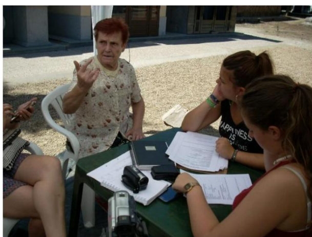
Voluntarias recogiendo testimonios de familiares durante las excavaciones en las fosas de Villanueva de la Serena

Entre las actividades realizadas durante el Campo de Trabajo para la recuperación de la memoria histórica de Villanueva de la Serena, además del trabajo de archivo y la excavación de una parte de la fosa común en el cementerio de Villanueva de la Serena, se procedió a la recogida de testimonios orales. Para nosotros, el testimonio oral forma parte fundamental de la investigación en cuestiones de memoria histórica. Es una herramienta que aporta información muy relevante sobre los hechos acaecidos, sobre los familiares y datos de personas “desaparecidas” que no aparecen inscritos en ningún registro o información para la localización de posibles fosas. Los testimonios orales nos aportan aquella información que el documento oficial (tengamos en cuenta que hablamos de una dictadura), en muchos casos, manipuló o reinterpreto para ajustar a la versión de los vencedores. El testimonio oral recoge las vivencias, el sufrimiento y los deseos de justicia de las víctimas de la dictadura, y da voz a quien no tuvo la oportunidad de ofrecer su versión sobre los hechos. Estudiados con espíritu crítico, nos sirven para reconstruir esas pequeñas historias familiares que forman parte de la historia general. Veamos algunos de ellos.