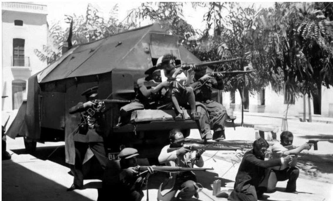
Camión blindado republicano fabricado por la milicias de Mérida, en los combates para recuperar Villanueva de la Serena. Mundo gráfico, 5 de agosto de 1936

Conforme acontece en todos los sitios de donde se echa a los traidores, el vecindario, y aun muchos de los que a la fuerza estaban con los insurgentes, fraternizaron con las columnas libertadoras. En gran número de casas aparecieron enseguida colgaduras y banderas republicanas, puede afirmarse que toda la población se unía en un inmenso "¡Viva la República!", mientras se multiplicaban los agasajos del pueblo a quienes les han devuelto la tranquilidad. Todo el vecindario se queja de las tropelías y desafueros cometidos por los fascistas desde que se produjo el alzamiento. Los servicios técnicos que acompañan a las columnas se emplean, con gran actividad, en la recomposición de las líneas telefónicas telegráficas que unen con Badajoz a Villanueva de la Serena. Y se cree que hoy mismo podrá comunicarse perfectamente entre ambas poblaciones.