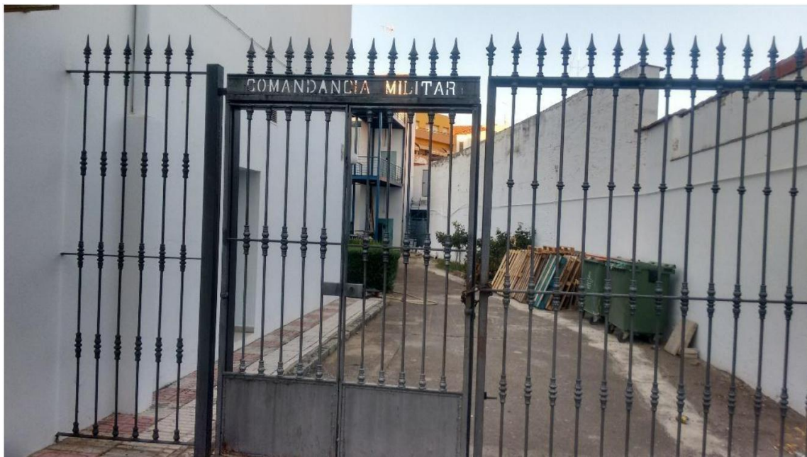
Restos de la antigua Comandancia Militar en Villanueva de la Serena

locales y contactos con otras entidades. Todo ello serviría de base para la labor represiva tras el fallido golpe de Estado del 18 de julio y los hechos que sucedieron en Villanueva de la Serena, con la detención de más de 50 personas en los primeros días.