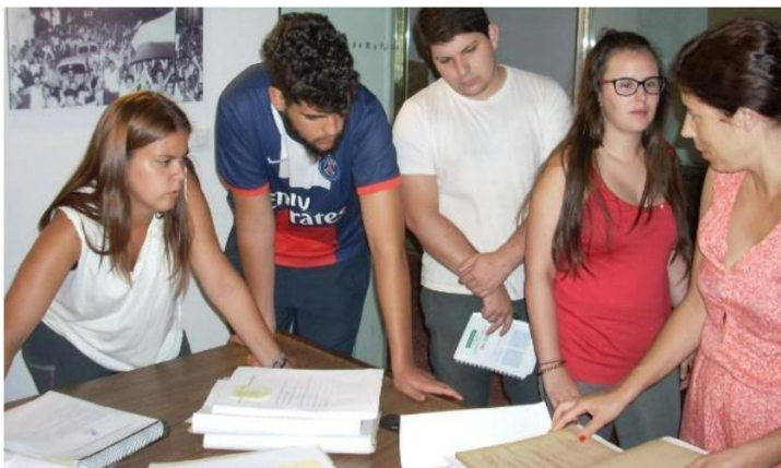
Voluntarios/as con la persona encargada del Archivo Municipal de Villanueva de la Serena