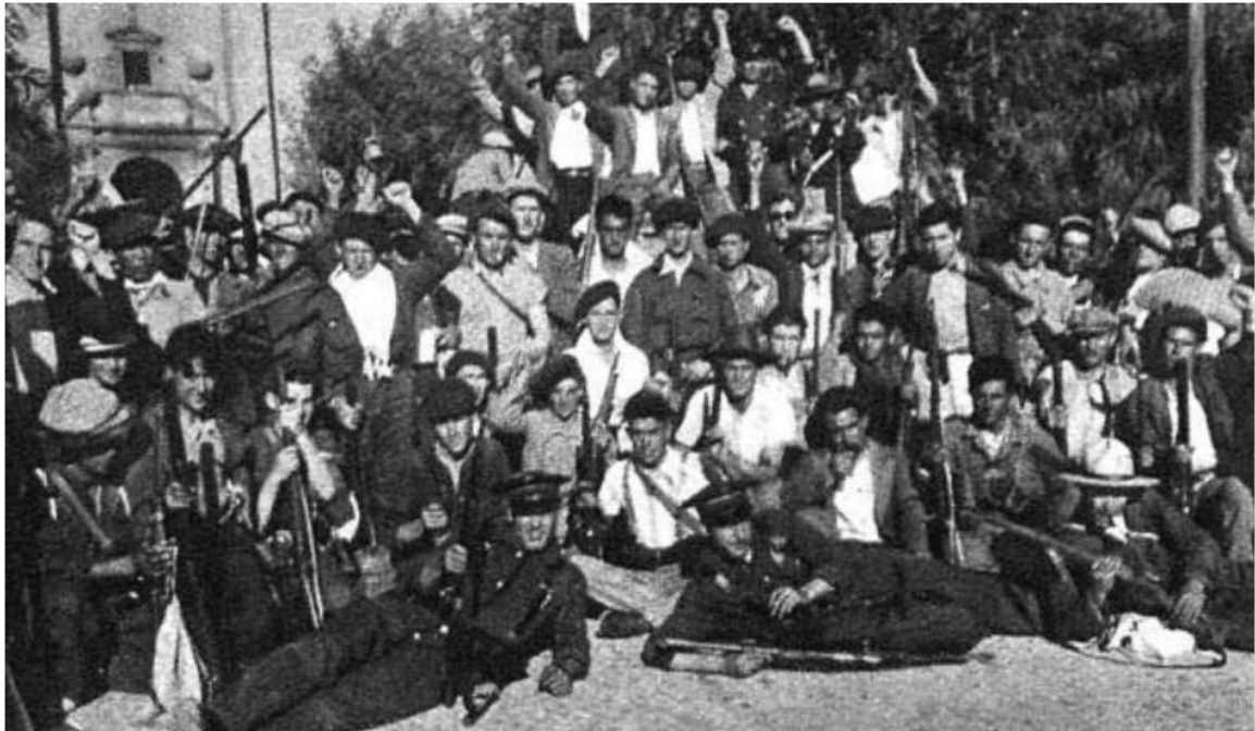
Milicianos y tropas leales tras recuperar Villanueva de la Serena en julio de 1936.

más resultaron heridos 90 . No conocemos las posibles cifras de las bajas causadas entre los republicanos. La mañana del día 30 de julio las tropas gubernamentales pudieron recuperar la ciudad.