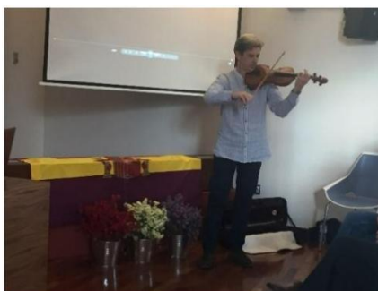
Acto de homenaje y entrega al Ayuntamiento de Villanueva de la Serena, junio 2017, de los restos recuperados en la excavación de la fosa por la ARMHEX