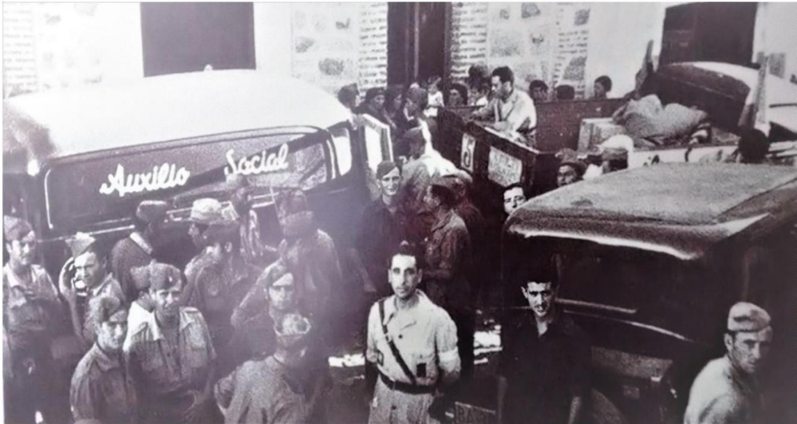
Foto Auxilio Social falangista.