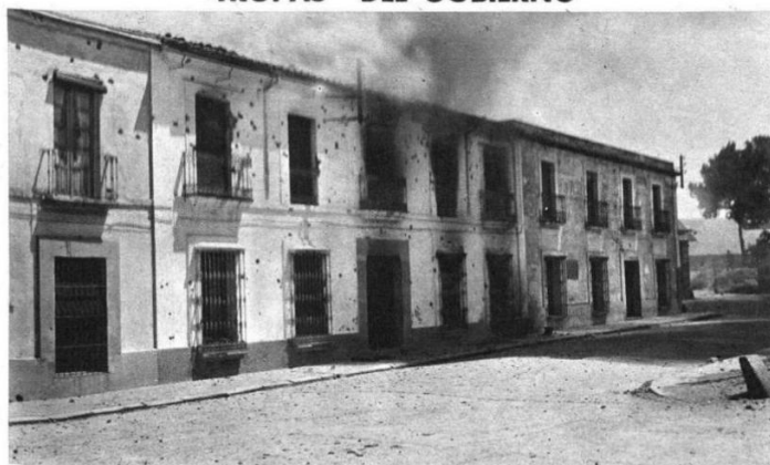
En esta casa se hicieron fuertes los rebeldes. Vean ustedes los efectos del tiro de las tropas del Gobierno en las fachadas