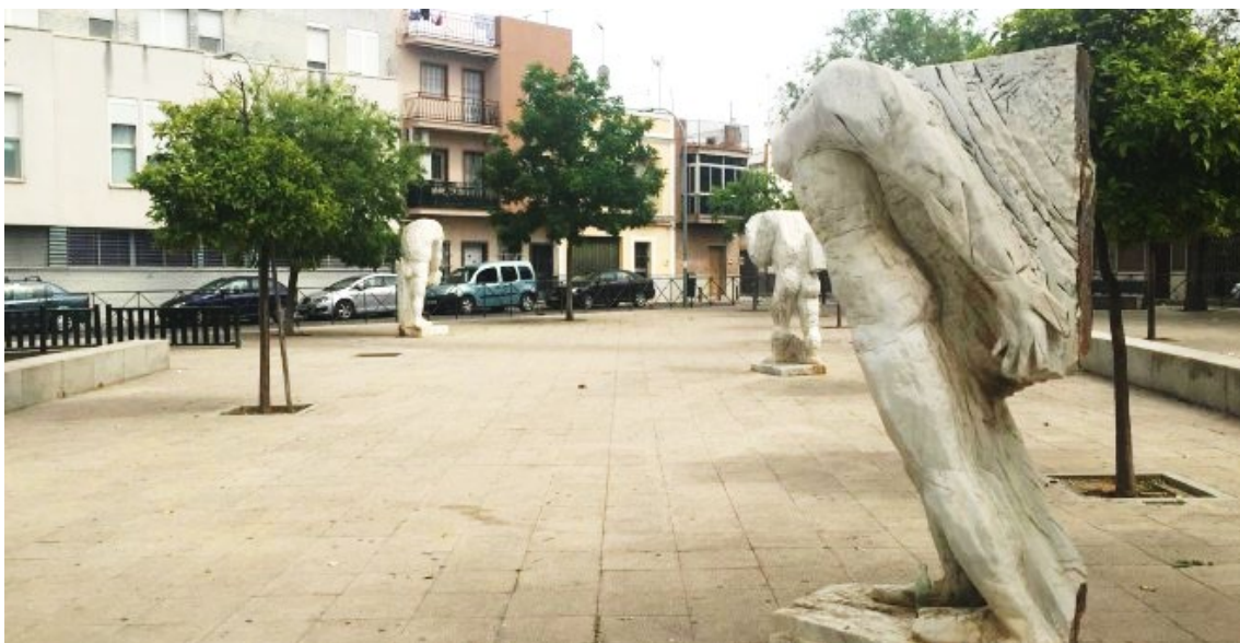
Plaza en Bellavista (Sevilla). Representa a los presos del canal, pero no hay rotulación

La memoria debe anclarse en lugares singulares que la sociedad hace emblemáticos. De ahí la necesidad que la recuperación de este espacio donde se ubicara el campo de concentración de Heliópolis , el primero de una larga lista de Sevilla y sus alrededores, no sea flor de un día. Hemos visto con pesar, cómo lugares que fueron creados para el reconocimiento han ido perdiendo el sentido de su origen. La famosa plaza del Retiro en Bellavista tiene desde 1988 un monumento consistente en un grupo escultórico, con el nombre oficial, según la web del Ayuntamiento “Monumento a los constructores del canal” . No existe ninguna referencia en esa plaza a la obra y a cómo y quiénes la construyeron. La misma nomenclatura “constructores” niega la existencia de los presos y de los trabajadores forzosos.