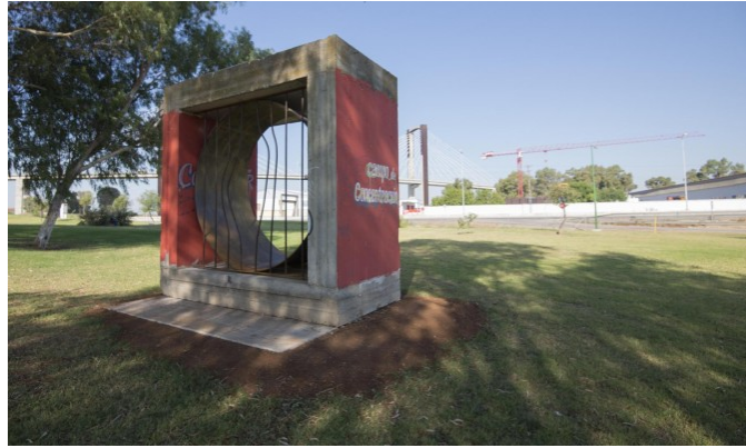
El monolito que se inaugurará esta tarde en homenaje a los presos esclavos del franquismo.

Con 12.000 euros de presupuesto , el grupo RMHSA-CGT.A ha aportado el grueso del coste, mientras el Ayuntamiento, a través del área de Parques y Jardines, ha construido la cimentación que soporta el bloque de hormigón , trabajo valorado en más de mil euros; y se han recaudado unos 900 euros de aportaciones voluntarias .