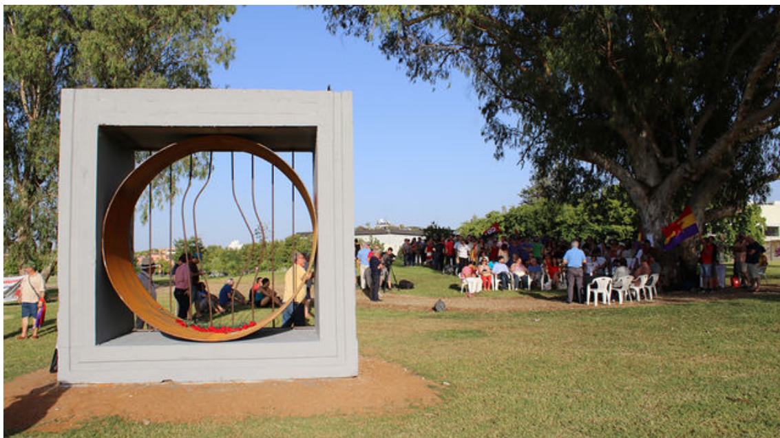
Un bloque de hormigón reciclado como base para reconocer a los presos políticos. DANIEL ANDANA

El Ayuntamiento sevillano fue "beneficiario de aquella primera obra pública realizada por los presos del franquismo", recuerda el grupo Recuperando la Memoria de la Historia Social de Andalucía (Rmhsa de CGT-A) en un comunicado. El colectivo memorialista ha promovido un reconocimiento "reivindicado desde 2002" y que ha contado con el respaldo del Consistorio hispalense.