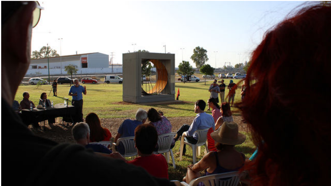
Monumento a los esclavos del franquismo inaugurado en Sevilla.