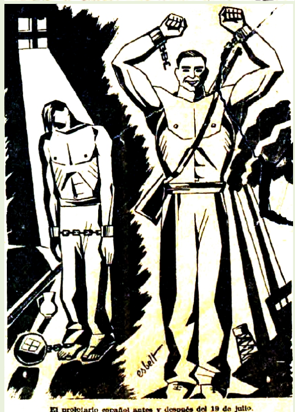
El proletario español antes y después del 19 de julio.